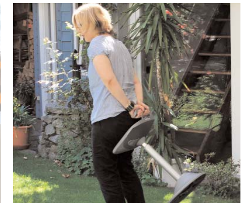
Dem Innenarchitekturbüro monika slomski gefällt das ansprechende Design.