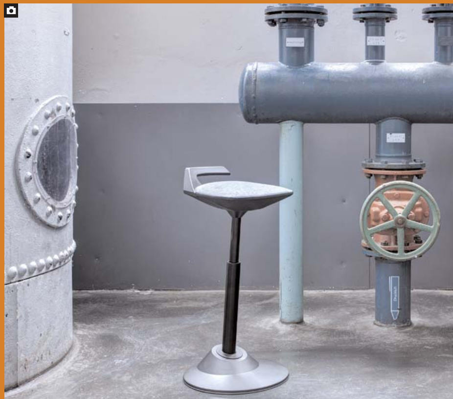
Weitere Informationen zum Vario-Aktiv-Steh-Sitz movman von aeris erhalten Sie unter www.aeris.de

Sitzen oder Stehen? - Beides geht mit dem movman von aeris . Immer mehr Arbeitsplätze stellen neue Herausforderungen an die dazu gehörigen Sitzmöbel. Ergonomisch sinnvoll sollen sie sein und in voller Bandbreite einsetzbar. Diesem Thema hat sich die Firma aeris - Impulsmöbel GmbH angenommen und den movman entwickelt. Der movman ist ein innovativer Vario-Aktiv-Stehsitz, der sich dem Be-Sitzer mehrfach variabel anpasst und für ergonomisch optimales, flexibles Sitzen und Stehsitzen in jeder Höhe sorgt. Er erfüllt höchste Ansprüche und ist mit vielen Innovationen ausgestattet: Der movman macht jeden Positionswechsel mit - in Höhe, Nei-