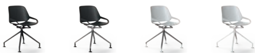
05. Aeris Numo Fußkreuz mit Gleitern